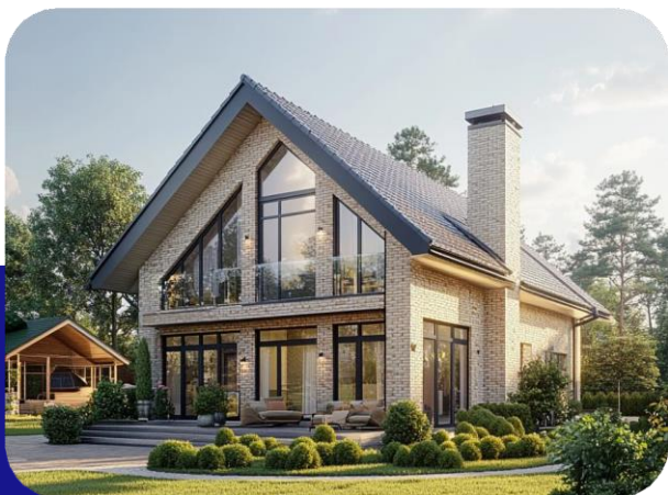
ИЖС – индивидуальные жилые дома