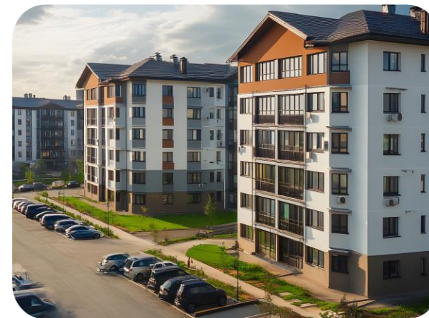
Малоэтажные многоквартирные дома